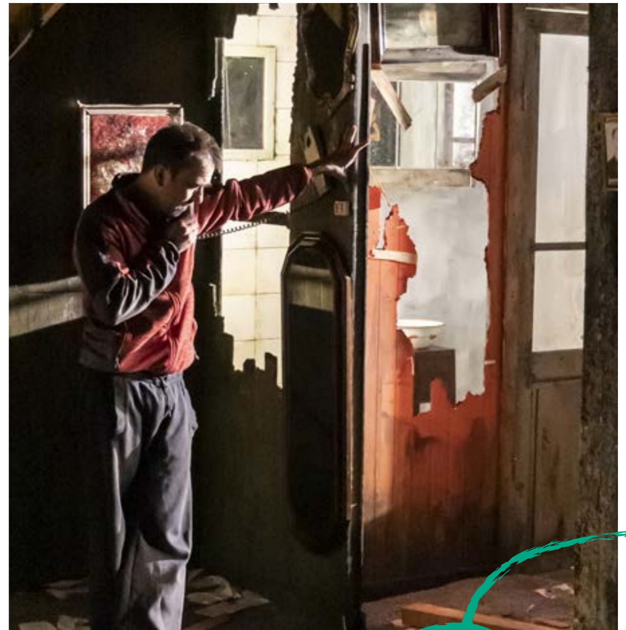
Résidence à La Brèche

Frais de séjour des personnes selon planning du producteur