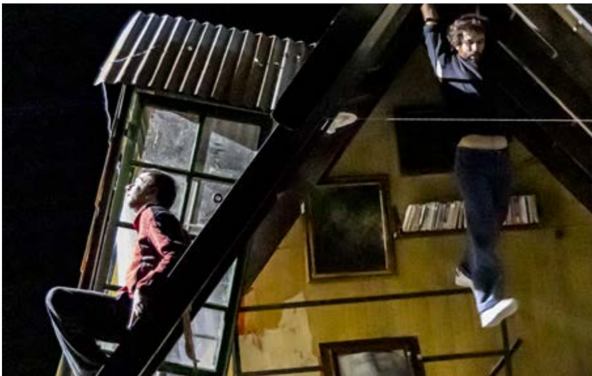
Résidence à La Brèche