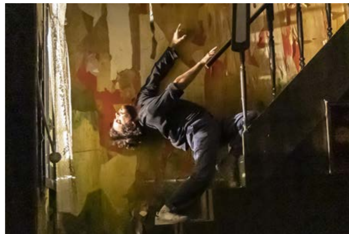
Résidence à La Brèche

Cette recherche sur l'espace, les installations, les objets, les matières, les liens entre l'intérieur et l'extérieur, se construit en dialogue avec l'écriture sonore, et l'écriture du mouvement.