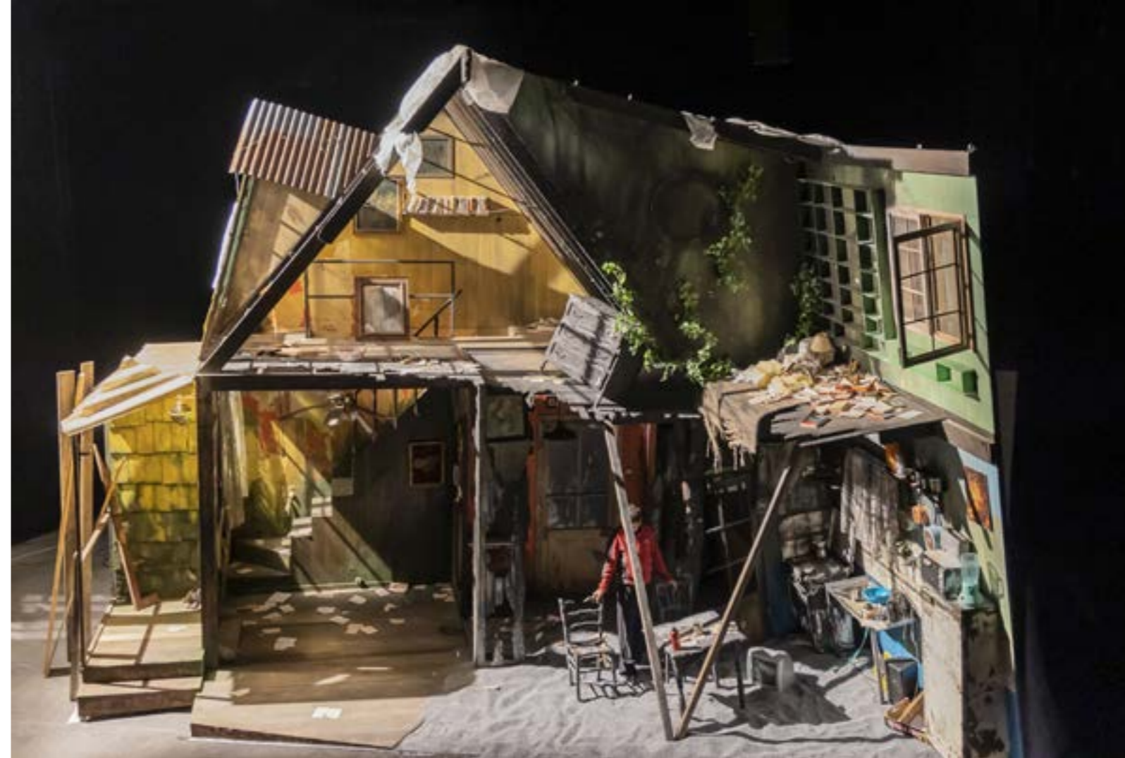
Résidence à La Brèche

Il y a une chose que le feu n'a pu emporter, c'est la mémoire de ses deux habitants, toujours présents, sous forme d'âmes ou d'êtres humains, acceptant le destin et continuant à vivre en ces lieux comme si rien n'avait changé, n'essayant même pas de contredire la nature en tentant la réparation de leur ancienne demeure.