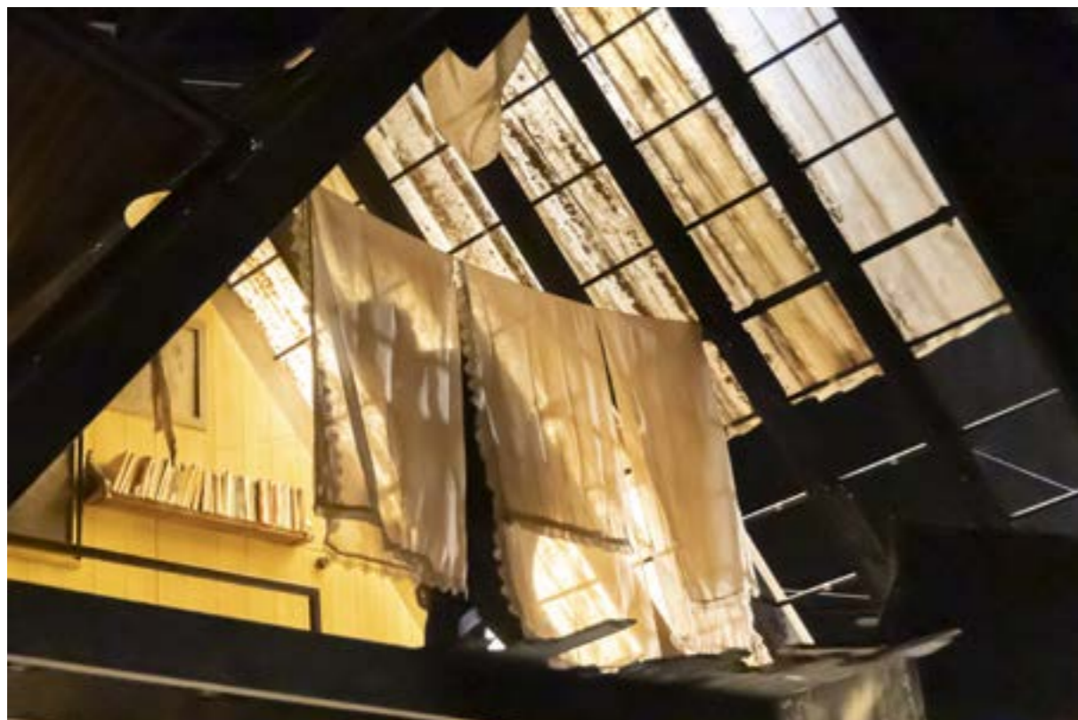
Résidence à La Brèche

L'espace de jeu est en perpétuel mouvement, par sa fragilité structurelle, et par la vie qui y persiste à l'intérieur.